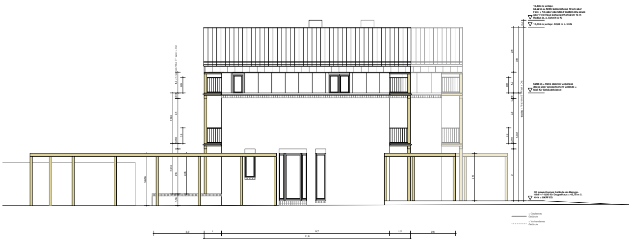
Ansicht West / Planung

Auf einem im Zehlendorfer Süden liegenden Grundstück sollen zwei spiegelgleiche Einfamilienhäuser errichtet werden. Bedingt durch den schmalen Zuschnitt des Grundstücks und den Vorgaben des Baunutzungsplanes entwickeln sich die Häuser in die Tiefe des Grundstückes.