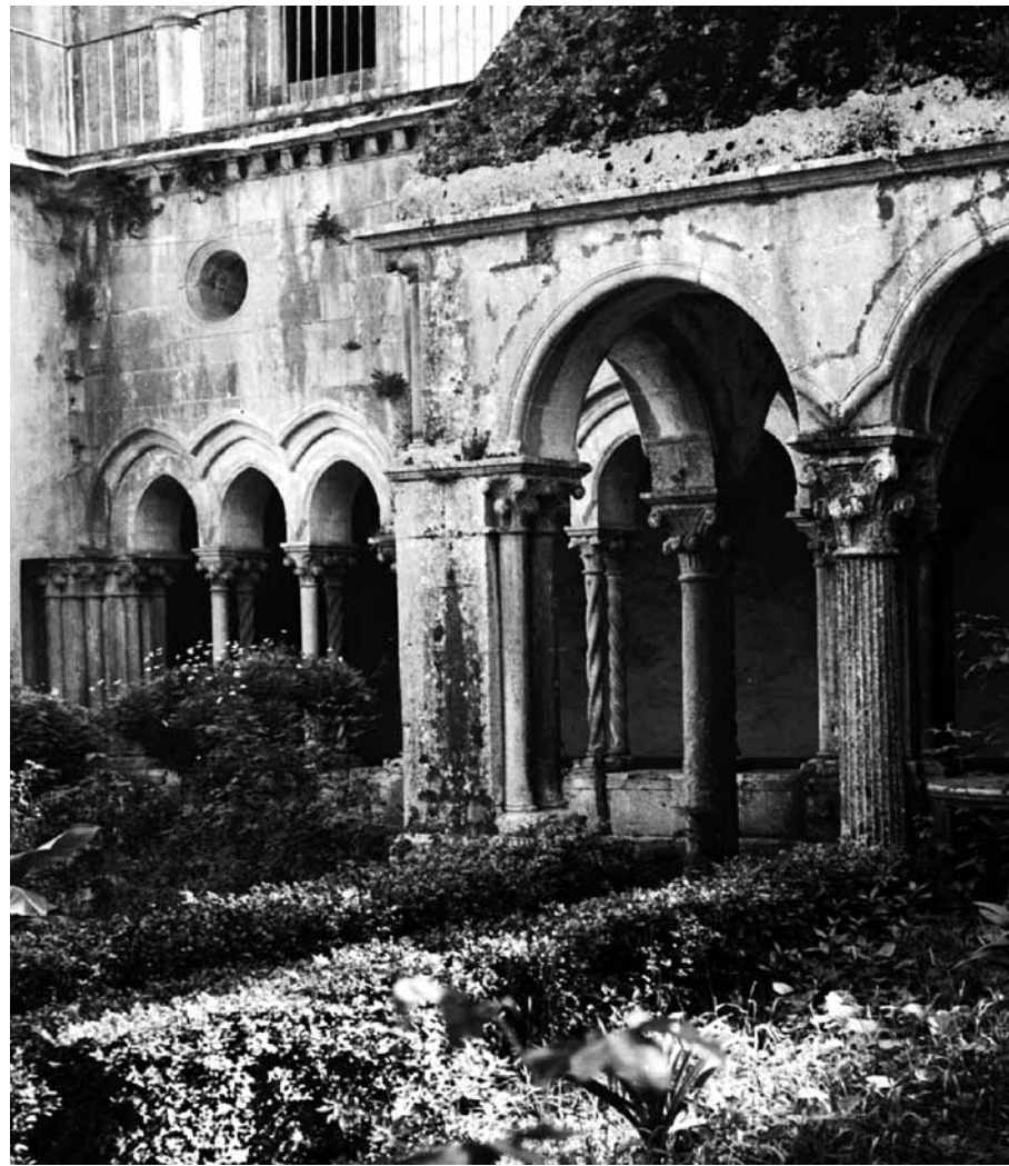
Im brunnengesäumten Kreuzgang wie im archaisch wirkenden Kirchenraum herrscht Stille.

die Arbeiten Rudolf Schwarz', der dem modernen Kirchenbau den Grossteil seiner Gedanken widmete. Und natürlich das Werk Mies van der Rohe, der sich bekanntermassen den Satz Aquins: „Das Schöne ist der Glanz des Wahren“, zum Wahlspruch seines Bauens machte – was alles sagt und den Kreis dieser Betrachtung der heutigen Relevanz sakralen Bauens schliesst. ▲▲▲