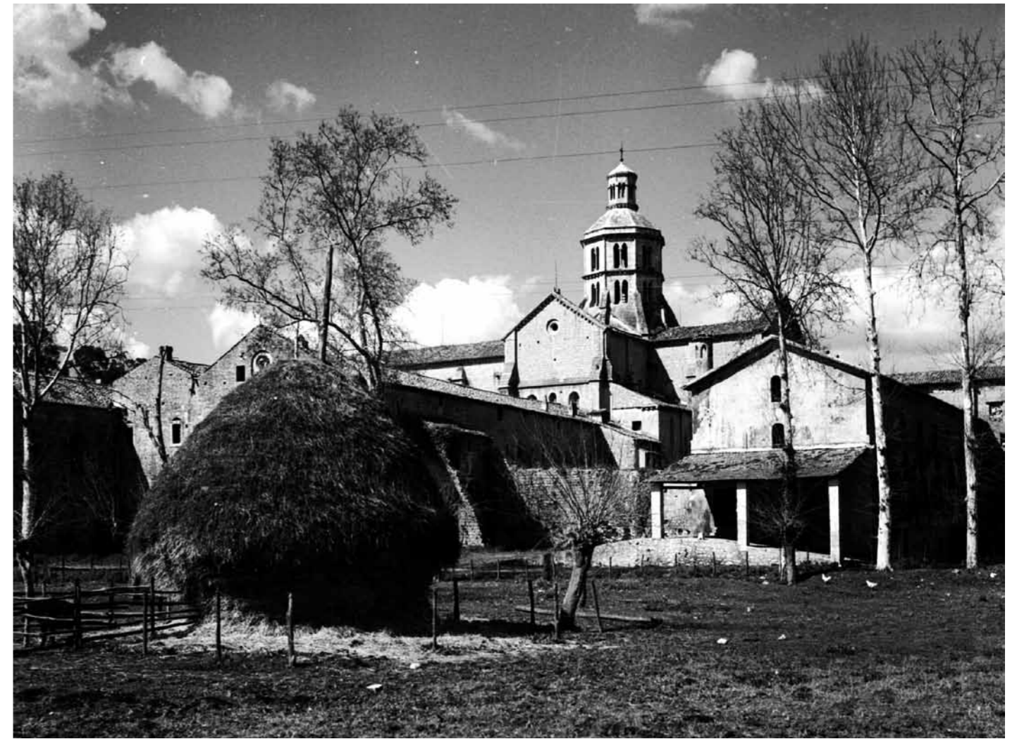
Das Zisterzienserkloster liegt umgrenzt von einem kleinen Wald inmitten einer durch eine industrialisierte Landwirtschaft ausgewrungenen und verdorrten Landschaft im Süden von Rom.

Zur ersten Frage kann man sagen, dass ein wie in Fossanova gesehener Wahrheitsausdruck nicht genuin an den christlichen Glauben gebunden sein muss, was Kant in seiner ästhetischen Theorie für das moderne Denken darlegte. Kant aktualisierte die von Aquin postulierte Kongruenz der Wahrheits- erfahrung im Moment der Schönheit, indem er die ästhetische Erfahrung der Schönheit allein auf die Natur bezog und sich eines Urteiles über den Grund dieser Schönheit, einen angenommenen Gott beispielsweise, enthielt. Dieses deshalb, da eine solche Annahme Gottes für ihn eine unzulässige Überschreitung der Grenzen des menschlichen Wissens darstellt. Für Kant zeigte sich dabei – ganz gleich der beschriebenen Wirkung Fossanovas – im Moment der Schönheit der Natur eine Idee, ein Sinn und damit eine Wahrheit der Natur selbst, die in der Erscheinung des Lebendigen selbst liegt. Denn alles, jede Einzelercheinung der Natur scheint im Moment ihrer Schönheit auf die Entfaltung der Individualität des Lebendigen hin abgestimmt und durch diese Idee sinnhaft verbunden: vom Stein als dem Abgelagerten des Lebens über die Pflanze als dem daraus Wachsenden bis zu mit ihnen verbundenen Tieren und