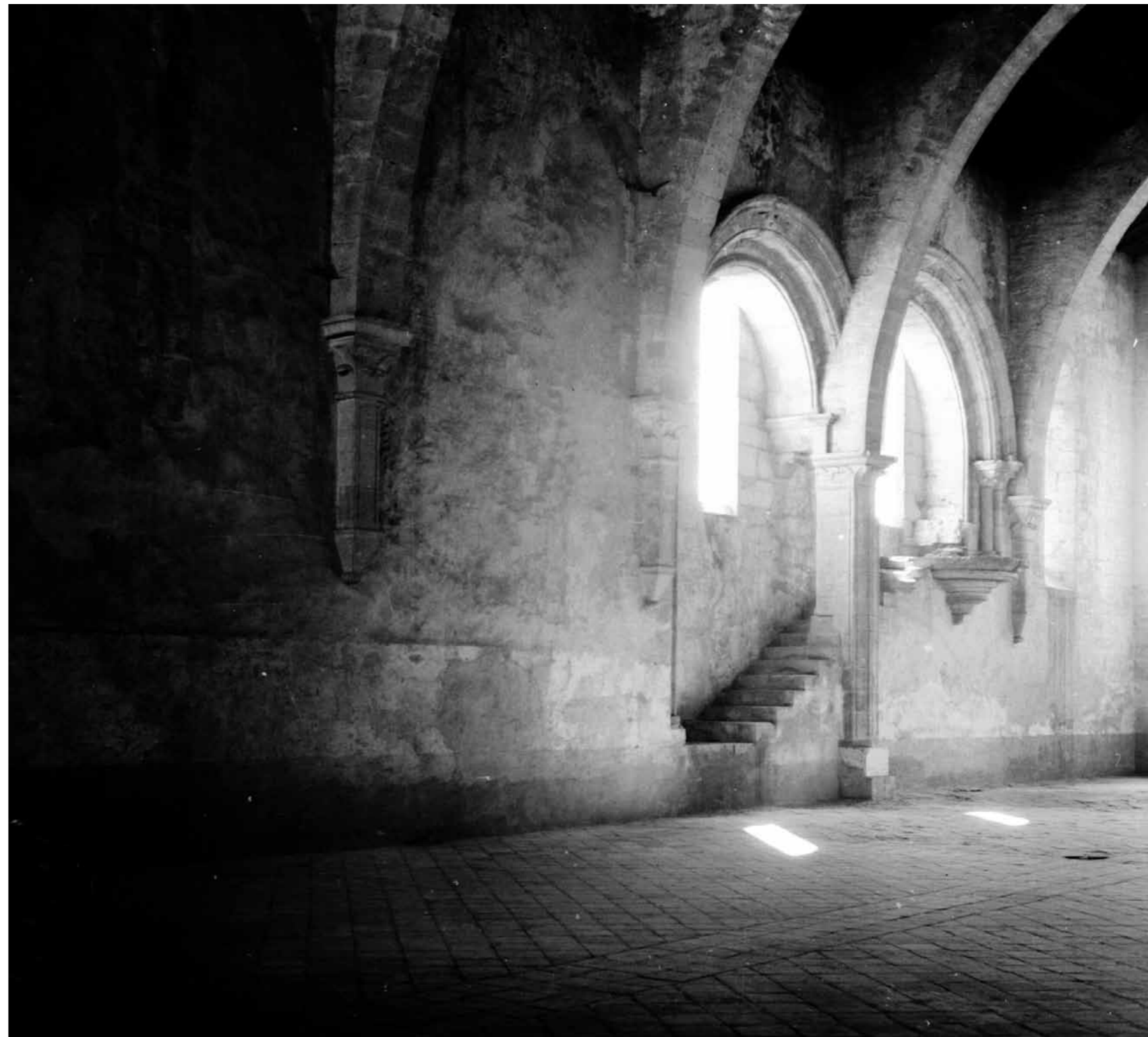
„Das Schöne ist der Glanz des Wahren“: Dieser Ausspruch von Thomas von Aquin, der 1274 im Zisterzienserkloster Fossanova verstarb, beschreibt die ästhetische Wirkung dieses Ortes auf eindruckliche Weise.

langatmigen Historienerzählung des christlichen bzw. des antiken Sakralbaus ausholen könnte. Solchen rein architekturgeschichtlichen Betrachtungen ist jedoch zumeist zu eigen, dass sie für die Welt der Wissenschaft zwar interessant sein mögen, sie Architekten oder auch Architekturinteressierte oft ratlos zurücklassen, da die zentrale Frage der Folgen für das eigene Handeln in der Gegenwart in der Regel nicht gestellt wird. In der Formulierung aber der Frage der Gegenwärtigkeit des sakralen Bauens ist eben die ganze Schwierigkeit benannt, hier zu leichten Schlüssen zu kommen. Denn wer vermag heute noch sicher zu sagen, was das Heilige für uns ist?